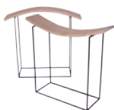
Höhen + Tiefen