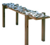
Tisch + Wort

Speisesaal der Mönche Refektorium | Heilsbronn