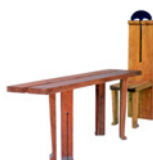
Macht + Vergänglichkeit