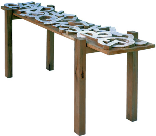
Andreas Kuhnlein, Tisch und Wort Birnbäum, 1994, 240 x 90 x 65 cm

Die Eröffnung dieser Ausstellung begehen wir in Form eines Themengottesdienstes.